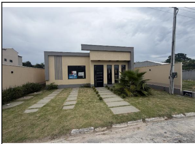
Identificação do Imóvel