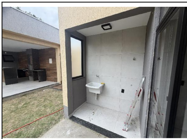
Área de Serviço