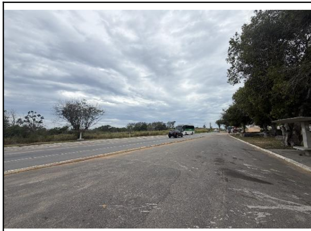
Rua de Acesso